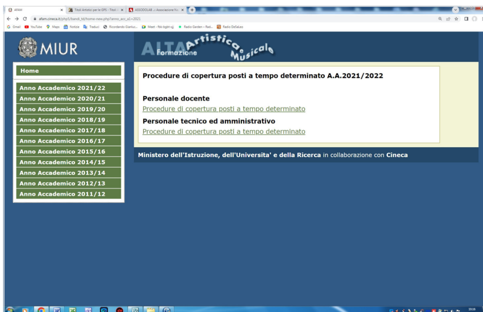
Sopra, il vecchio sito dell'AFAM https://afam.miur.it/sito/bandi.html

to delle norme generali contenute nella Nota numero 3154 del 9 giugno 2011 emanata dal MIUR – Direzione Generale di Alta Formazione Artistica Musicale e Coreutica. In essa vengono indicate sia la procedura per indire il bando da parte dei Conservatori di Musica, delle Accademie e Istituti Superiori di Studi Musicali, sia la modalità di costituzione delle commissioni giudicatrici, sia ancora il regolamento di presentazione delle domande.